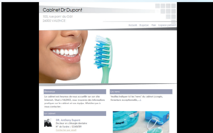
Maquette n° A05