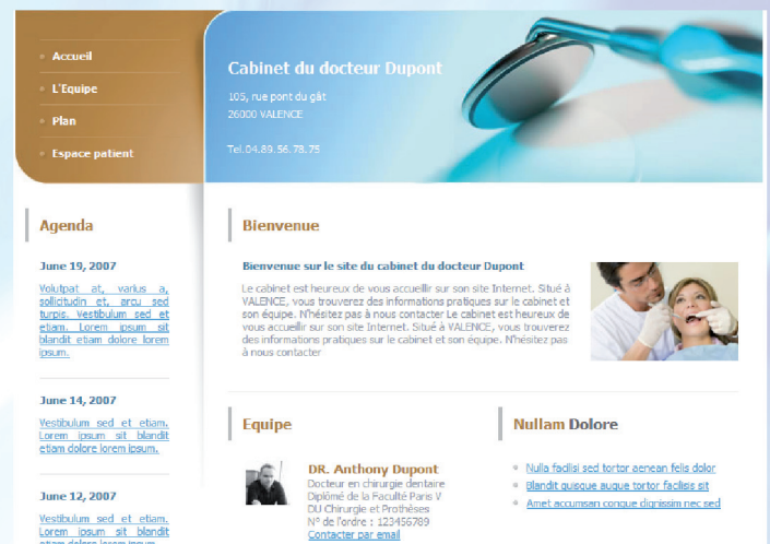
Maquette n° D04