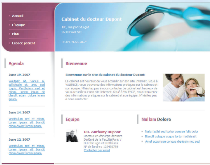
Maquette n° D02