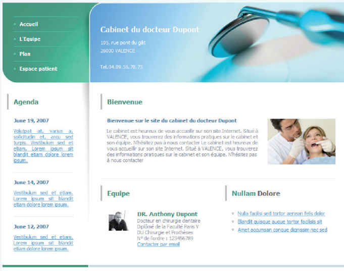
Maquette n° D01