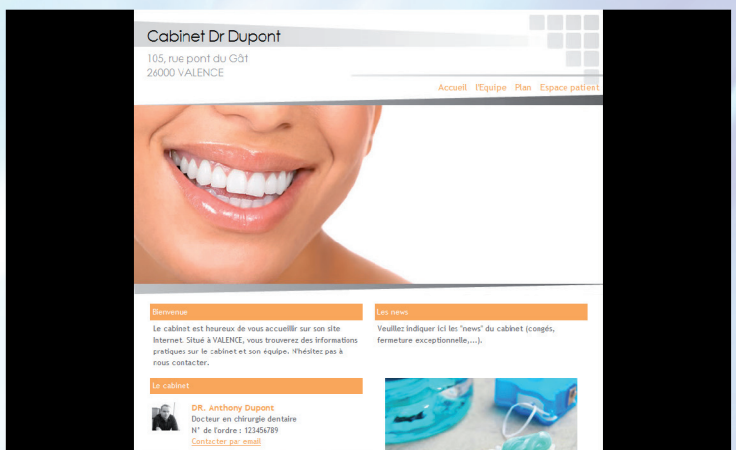
Maquette n° A06