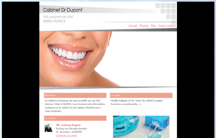
Maquette n° A04