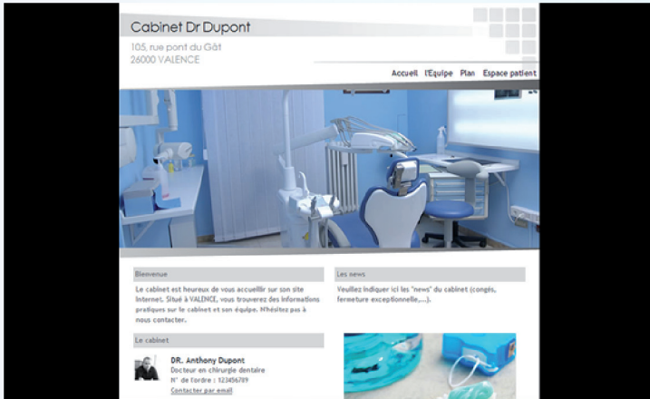
Maquette n° A01