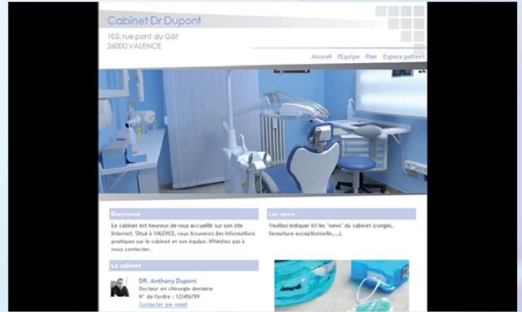
Maquette n° A02