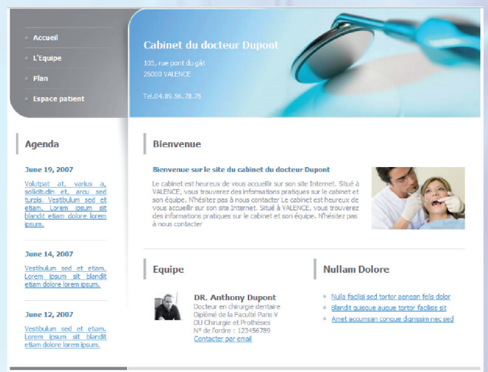
Maquette n° D03